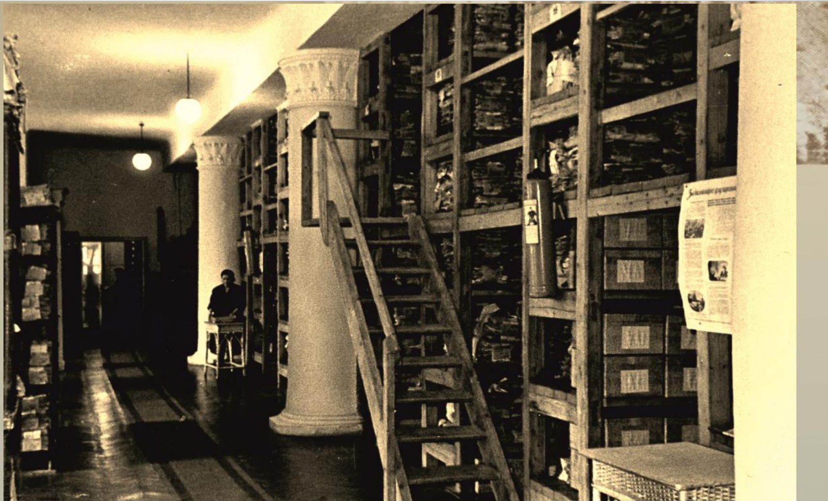
Архивохранилище ГАРО после ремонта. 1952 г.